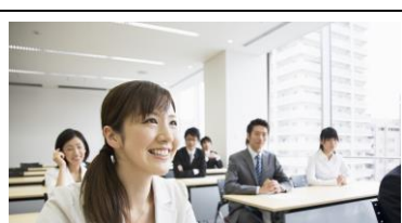
受講しやすいカリキュラム