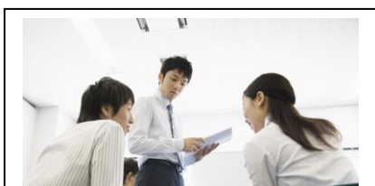
キャリアアップに活かせる資格